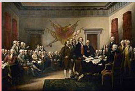
Jonh Trumbull festménye: Az öttagú bizottság benyújtja a Függetlenségi Nyilatkozatot a Kongresszusnak

We hold these truths to be self-evident, that all men are created equal, that they are endowed by their Creator with certain unalienable Rights that among these are Life, Liberty and the pursuit of Happiness. — That to secure these rights, Governments are instituted among Men, deriving their just powers from the consent of the governed, — That whenever any Form of Government becomes destructive of these ends, it is the Right of the People to alter or to abolish it, and to institute new Government, laying its foundation on such principles and organizing its powers in such form, as to them shall seem most likely to affect their Safety and Happiness.