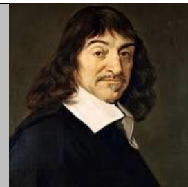
René Descartes 1596-160

A 17. századi filozófia már elszakadt a teológiától, a természettudományos ismeretekre épített, kialakult az észelvű, racionalista gondolkodás. A racionalista filozófia megteremtője a francia Descartes ('dékárt') volt, aki a világ értelmezésekor már nem Istenből, hanem az értelemről indult ki. Et nevezük descartes-i fordulatnak. Híres mondása: Cogito ergo sum . (kogitó ergó szum) – Gondolkodom, tehát vagyok . Az új filozófia jelentősége, hogy önálló gondolkodásra tanít, arra, hogy ne fogadjunk el készen kapott dogmákat 2 . Descartes szerint a világ racionális, törvényei matematikai úton magyarázhatók. Ő még nem zárta ki Isten létét, szerinte Isten fogalma velünk született. Ezzel egy új vallás, a deizmus jött létre. A deisták szerint Isten csak megteremtette a világot, de további működésébe nem szól bele, Isten tehát csak „első mozgató”.