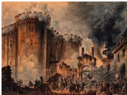
A Bastille ostroma

Az alábbi képen a Bastille ostroma látható. Ez tekinthető a francia forradalom szimbolikus győzelmének, mert nemcsak a hírhedt börtön elpusztítását, hanem a királyság és a feudalizmus eltörlését is jelentette a „Szabadság, Egyenlőség, Testvériség” szellemében.