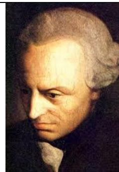
Immanuel Kant (1724-1804)

Immanuel Kant: A vallás a puszta ész határain belül és más írások, 1772