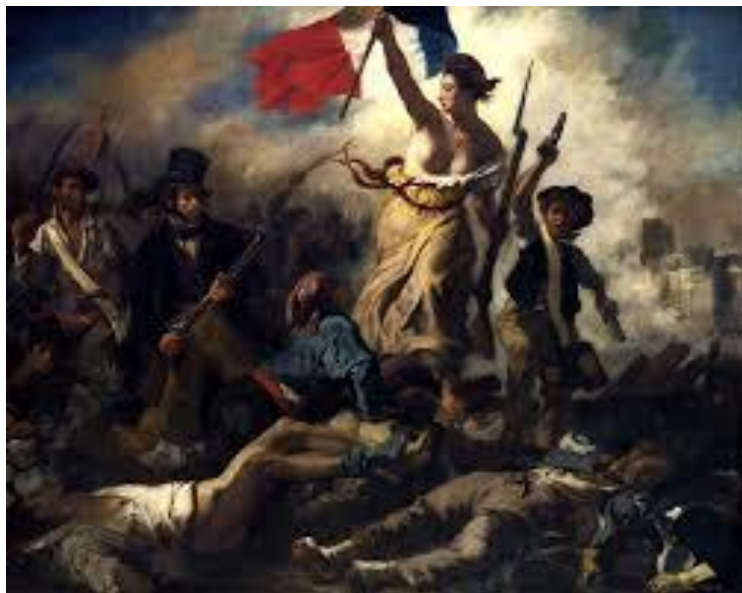
Delaroix: A Szabadság vezeti a népet