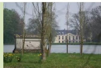
Ermenonville, Rousseau lakhelye

Rousseau korszakalkotó műve az Émile , amely forradalmi szemléletváltást hozott a pedagógiában. Rousseau elképzelése szerint a gyermek partner a nevelésben, akit kezdetben a természetben kell nevelni természetes erkölcsökre, a szellemi nevelést csak jóval később szabad elkezdni. Ellenzi a testi fenyítést. A tanár feladata, hogy ne büntetéssel, hanem mértéktartó irányítással telerlessen helyes útra a gyereket. Rousseau még életében legendává vált, Ermenonville ('ermenonvij'), ahol lakott, zarándokhely lett a felvilágosodás hívei között. Nagy hatással volt Csokonai Vitéz Mihályra.