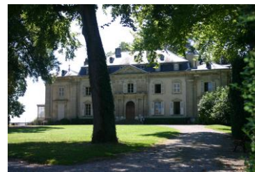
A ferney-i Voltaire-palota, amely zarándokhellyé vált, Európából ezrek látogatták meg itt a nagy gondolkodót.

A francia-svájci határon, Ferney-ben lakott, hogy üldözői elől bármikor megszökhessen. A katolikus egyház nem hagyta, hogy keresztény temetést rendezzenek neki. Voltaire liberális nézeteket vallott, leghíresebb mondását gyakran idézik: „ Egy szavával sem értek egyet, de mindhalálig harcolok, hogy mondhassa. ” Ez a másképp gondolkodóval szembeni tolerancia az, amely egy igazi demokratára jellemző.